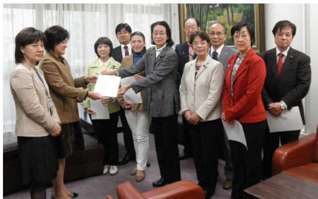
池戸女性活躍・男女共同参画担当理事(左から2人目)に申入書を手渡す日本共産党横浜市議団=11月20日、横浜市役所

申し入れでは、男女間賃金格差の是正の取り組みを重点施策として明確に位置づけ、具体的な事業を定めること、保育所・学童保育・高齢者福祉の充実、中学校給食の実施、小児医療無