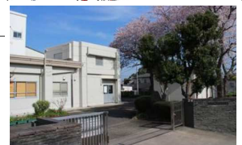
上菅田小学校（同校HPより）