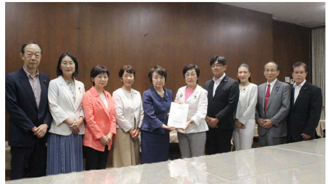
林市長に要望書を手渡す党市議団＝9月11日

開発優先からの決別などを求める市民要望は盛り込まれていません。同計画が、市民生活の実態と市民要望に目を向けたものとなっていないことは明白です。