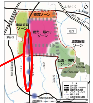
↑旧上瀬谷通信施設土地利用基本計画より