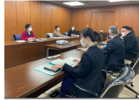
大阪市教育委員会との懇談