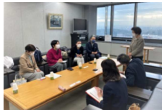
堺市教育委員会との懇談