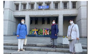
大阪市政府本庁舎前